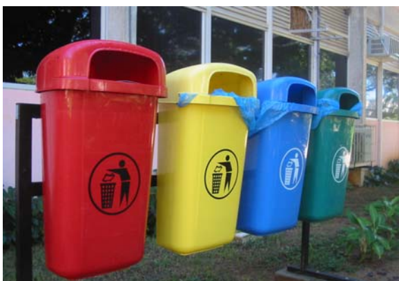
A Natal (Brésil)

Les chemins de fer allemands (Deutsche Bahn) ont introduit cette poubelle sélective depuis 1988. Elle est cloisonnée en quatre pour le verre, le papier, le plastique et les autres déchets. Là où elle est installée (dans les 200 plus grandes gares et dans les trains longue distance), le taux de recyclage atteint 70% (Source : La revue durable, n°22 oct-nov.2006)