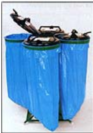
Chez le fabricant français Denios