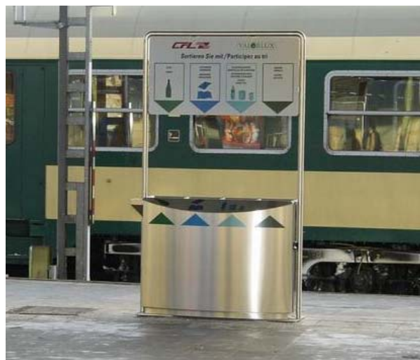
Dans la gare de Luxembourg-ville