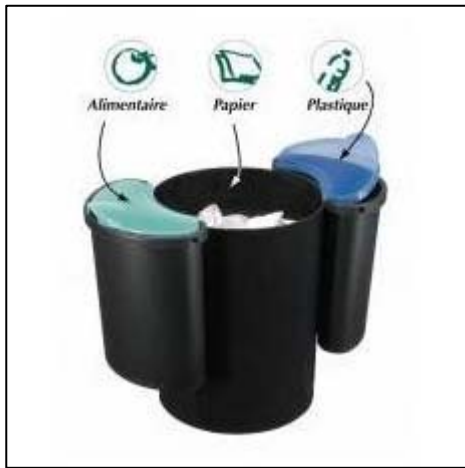
Poubelle de la marque Manutan, 16 litres