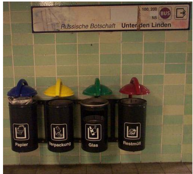
A Berlin (Allemagne)